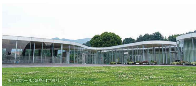
多目的ホール(妹島和世設計)